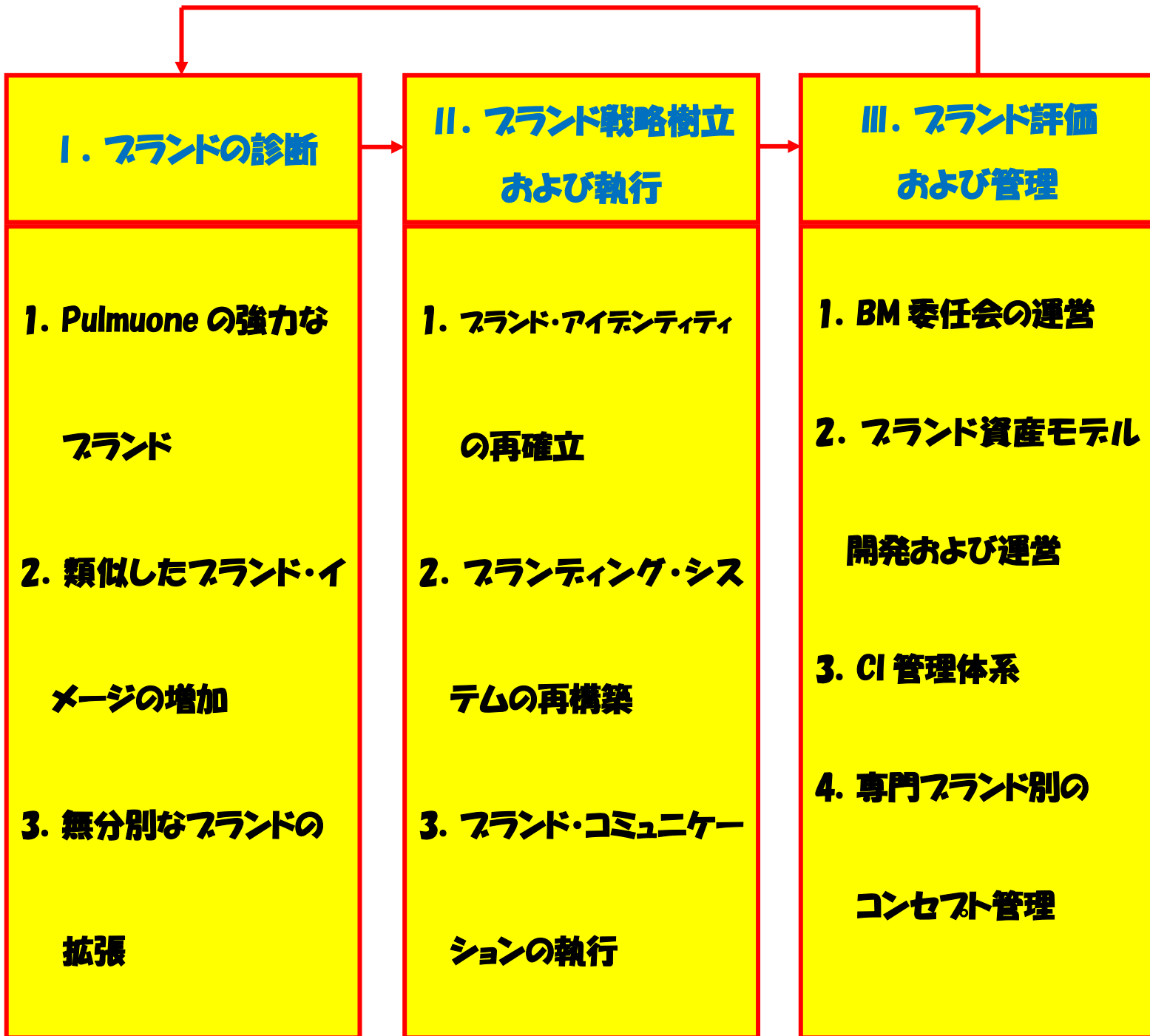
図 1 Pulmuone のブランド・マネジメント体系

注: BM(Brand Management), CI(Corporate Identity)